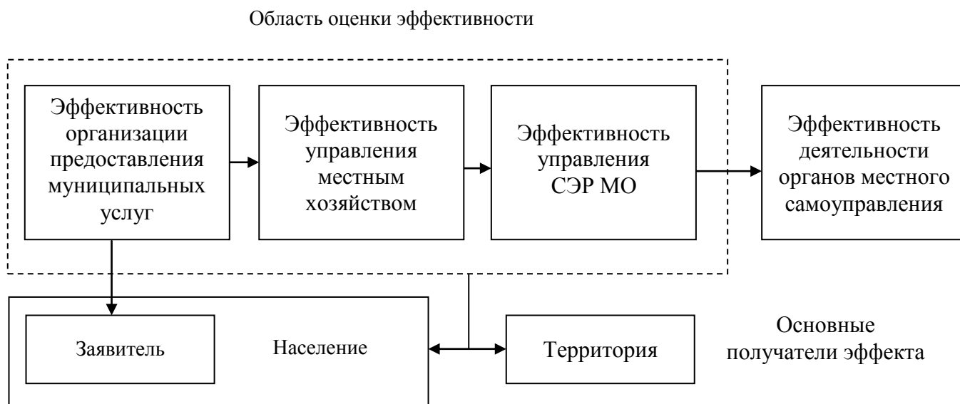
Рисунок 1 – Виды эффективности деятельности органов местного самоуправления*

Таким образом, при оценке эффективной деятельности органов местного самоуправления необходим учет следующих видов эффективности (рисунок 1).