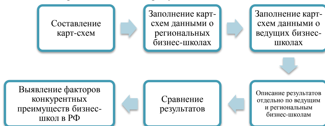
Рисунок 2 - Анализ отечественного опыта построения бизнес-школ*

Анализ отечественного опыта построения бизнес-школ проводился в несколько этапов, представленных на рисунке 2.