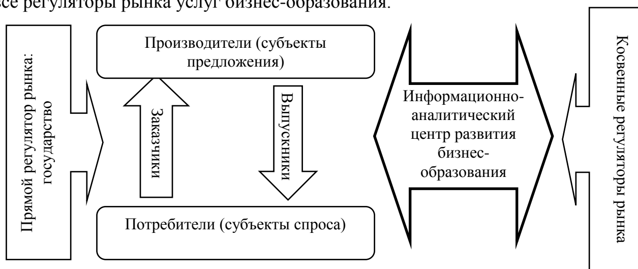
Рисунок 4 - Место центра на рынке услуг бизнес-образования*

В работе описана возможная организационная структура центра, особенности функционирования (включая источники финансирования). Уточнены принципы его работы (корпоративности, компьютеризации, обратной связи, открытости данных), определено место центра на рынке бизнес-образования России (рис.4). Предложенная автором концепция позволяет задействовать в процессе выполнения своих функций практически все регуляторы рынка услуг бизнес-образования.