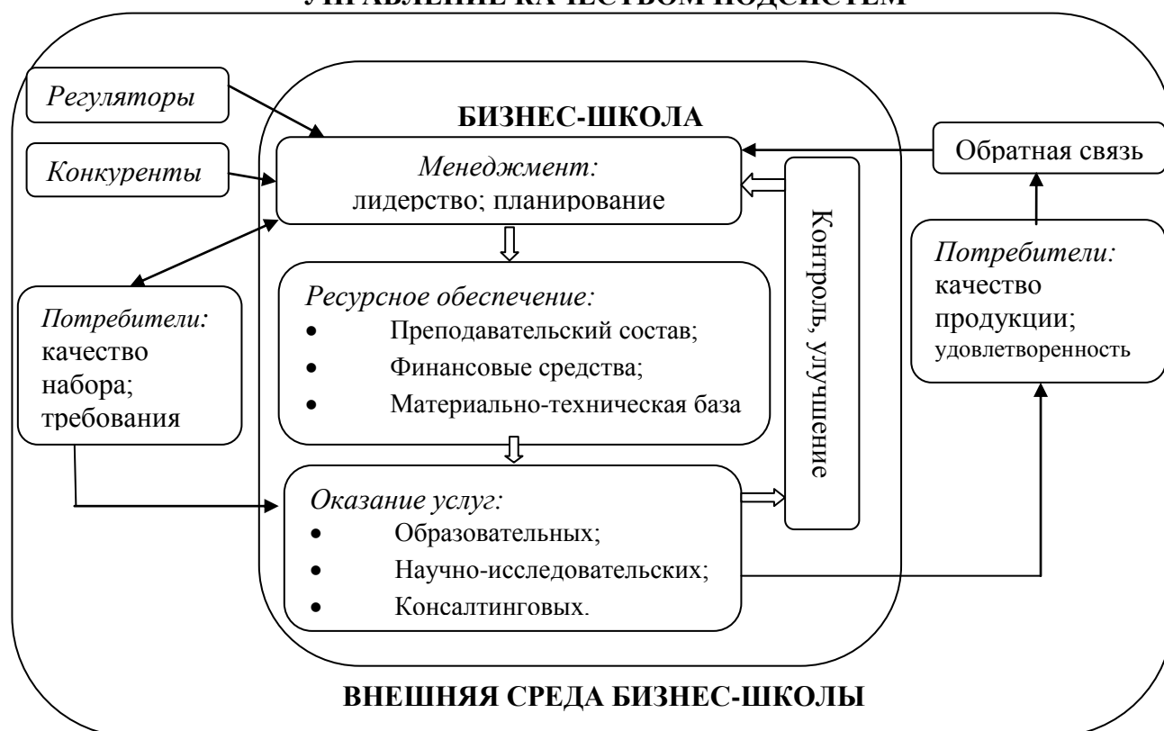
Рисунок 3- Модель управления качеством услуг бизнес-образования*