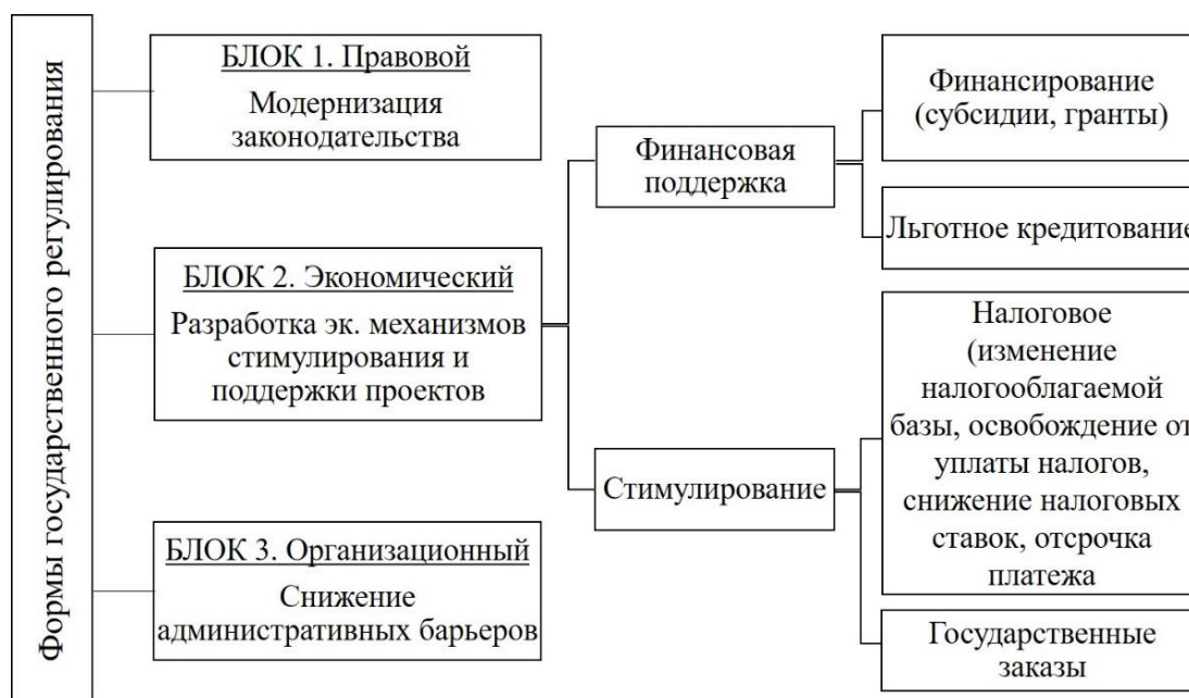
Рисунок 4 – Комплекс мер государственного регулирования сферы социального предпринимательства (составлено автором)

Реализация приоритетных направлений по формированию системы государственного регулирования социального предпринимательства возможна путем определения ряда мероприятий, которые сводятся к следующему.