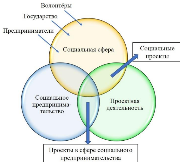
Рисунок 1 – Концептуальная модель проектов в сфере социального предпринимательства ( составлено автором )

Автором сформулированы основные принципы отнесения проектов к сфере социального предпринимательства: