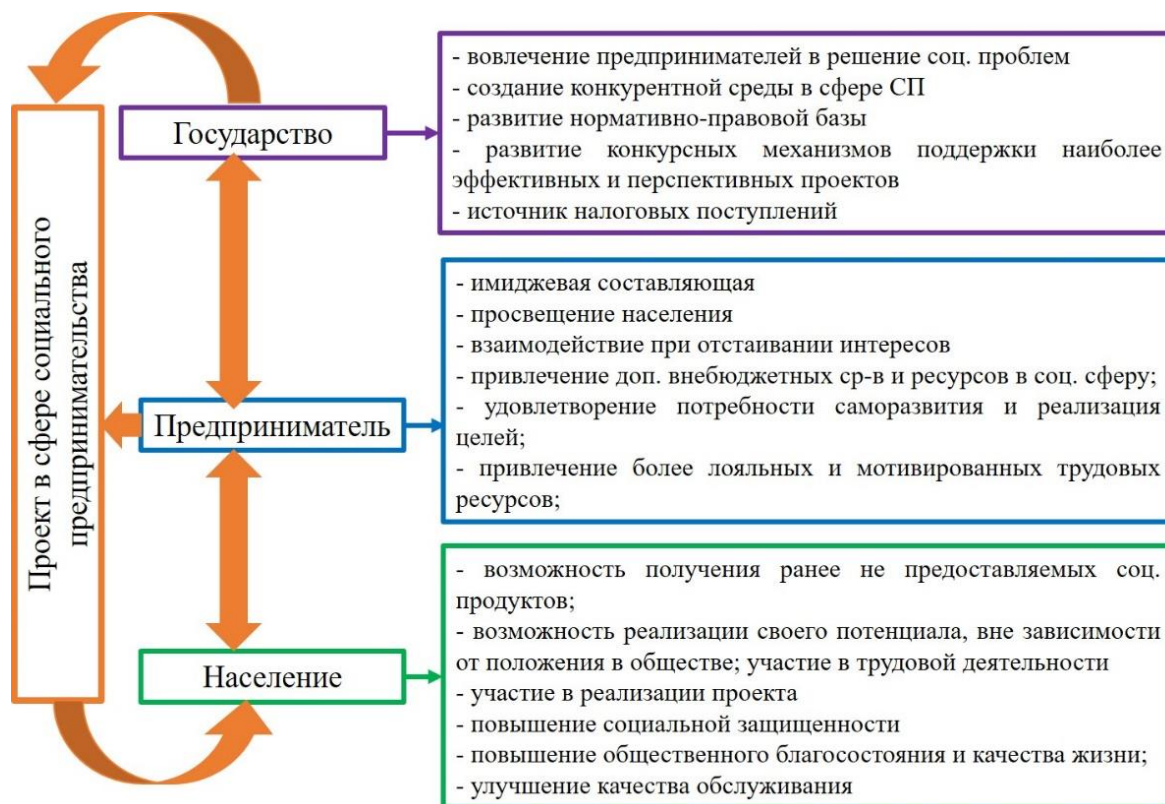
Рисунок 2 – Взаимодействие интересов сторон в процессе реализации проекта в сфере социального предпринимательства (составлено автором)

Реализация проекта в сфере социального предпринимательства предполагает взаимодействие лиц-участников процесса, которые были разделены на три группы: государство в лице государственных органов власти, пользователи в лице населения страны, индивидов или социально-незащищенных групп граждан, а также предприниматели, реализующие проект в сфере социального предпринимательства (рис. 2).