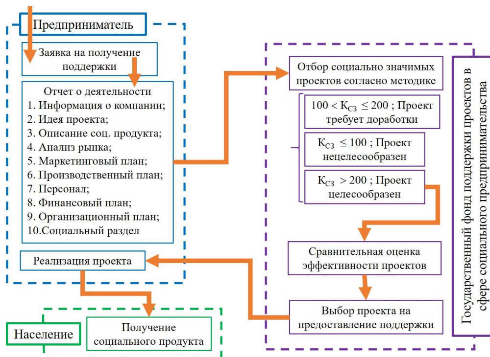
Рисунок 3 – Экономический механизм государственной поддержки проектов в сфере социального предпринимательства (составлено автором)

государственного фонда поддержки и населения, которое получает социальный продукт – товар или услугу в результате реализации проекта, а также повысить объективность отбора проектов, которым предоставляется государственная поддержка (рис. 3).