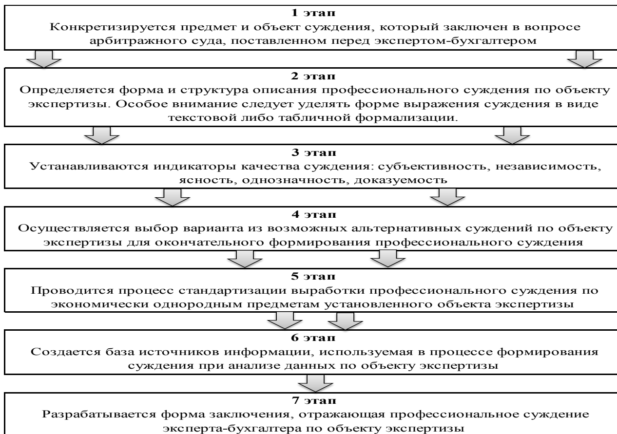
Рисунок 4 – Этапы формирования профессионального суждения эксперта-бухгалтера при проведении судебно-бухгалтерской экспертизы затрат пригородных пассажирских компаний

Автором предложено формировать профессиональное суждение эксперта-бухгалтера на основе семи последовательных этапов, представленных на рисунке 4.