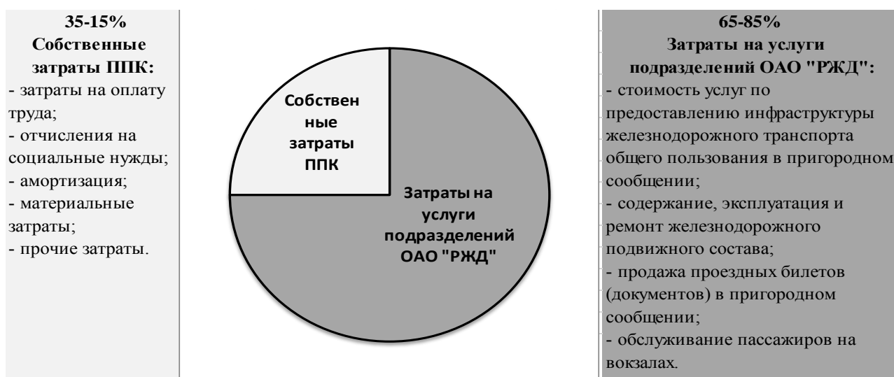
Рисунок 2 – Вариация фактических затрат пригородных пассажирских компаний

Методика судебно-бухгалтерской экспертизы затрат на оказание услуг железнодорожными пригородными пассажирскими компаниями связана с подтверждением экономической обоснованности и целесообразности фактов хозяйственной жизни по расходам на оказание этих услуг. Как показало обследование пригородных пассажирских компаний, таких как АО «Северная ППК», АО «Саратовская ППК» и АО «ППК Черноземье», за период с 2011 по 2018 годы, обоснованные, целесообразные и эффективные затраты перевозчика складываются из собственных расходов и издержек на услуги подразделений ОАО «РЖД», вариация которых представлена на рисунке 2.