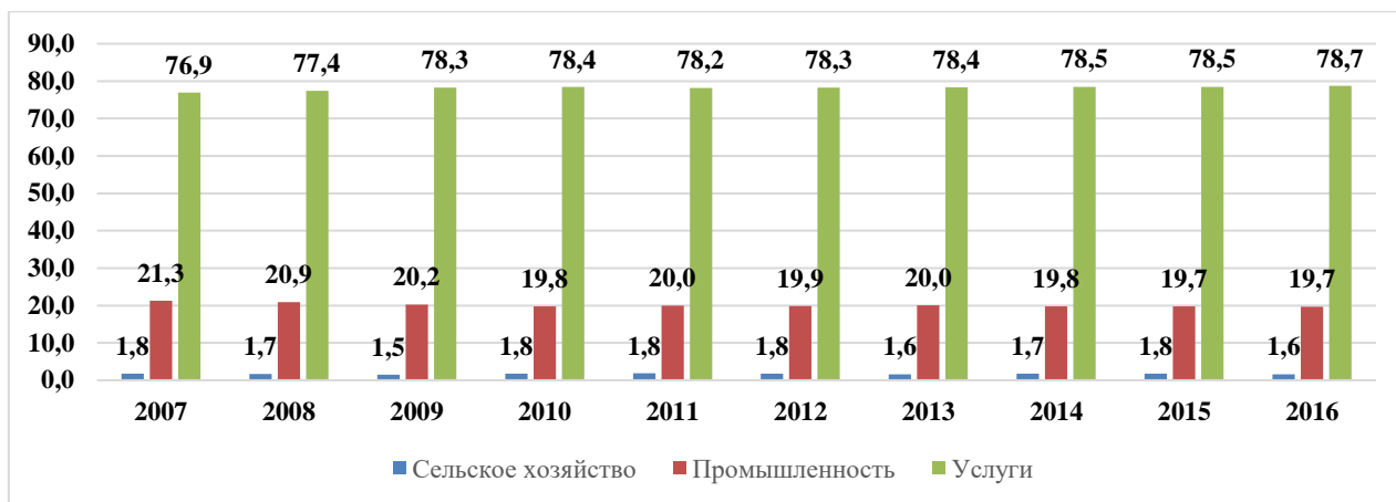
Рисунок 1 - Отраслевая структура экономики Франции, 2005-2016 гг., в %.

Источник: составлено автором на базе данных UnctadStat, 2017