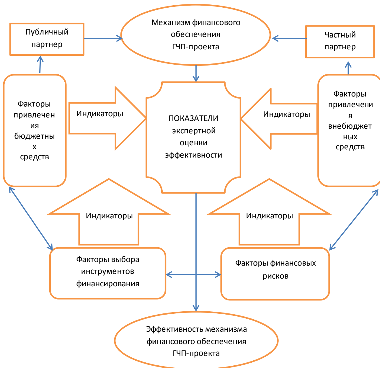
Рисунок 1 – Индикативная модель экспертной оценки эффективности механизма финансового обеспечения ГЧП-проектов в регионах в рамках анализа «затраты – результаты (выгоды) – риски»