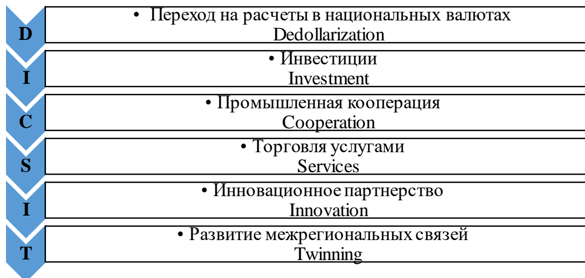
Рисунок 1 – DICSIT- концепция сотрудничества России с МЕРКОСУР